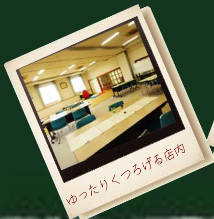
ゆったりくつろげる店内

誰でも自由に集えるみんなの居場所です。お好きな時間にふらっと立ち寄れる…自分のスタイルで自由にゆったり、ゆったり…お茶を飲みながらおしゃべりあり…そんな、なんでもありの居場所です。